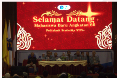
Gambar 1. Pimpinan Politeknik Statistika STIS Bersama Jajaran