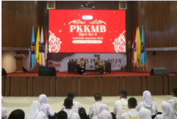
Gambar 17. Kuliah Umum BNN