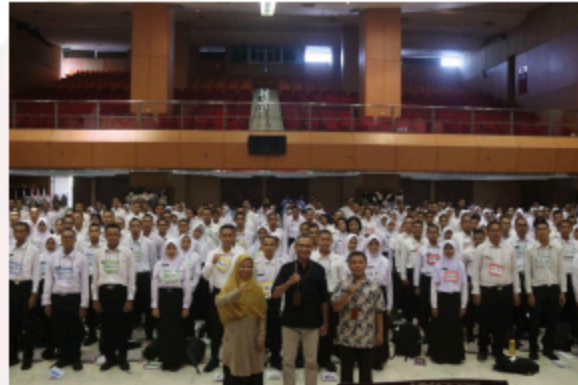
Gambar 18. Kuliah Umum Etika dan Tata Tertib