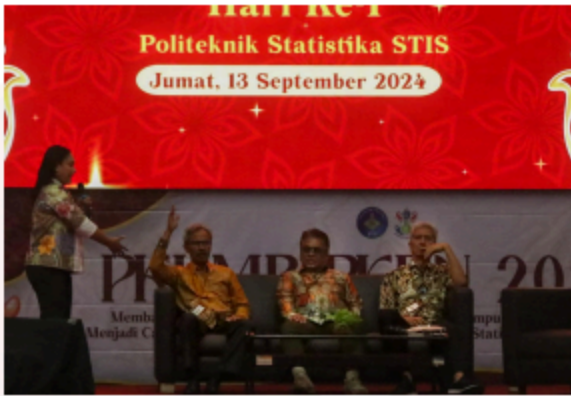
Gambar 11. Kuliah Umum tentang Bagian-Bagian yang Ada di Kampus