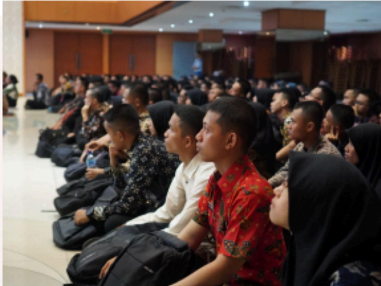
Gambar 5. Pengenalan dan Penjelasan Kegiatan PKKMB-PKBN