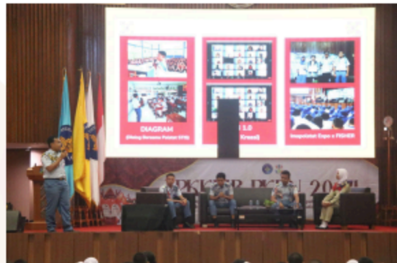
Gambar 14. Kuliah Umum tentang Pengenalan Organisasi Mahasiswa