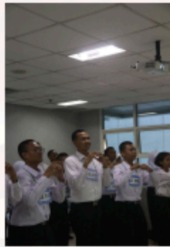
Gambar 19. Kegiatan Kelas Bersama Pendamping Kelompok