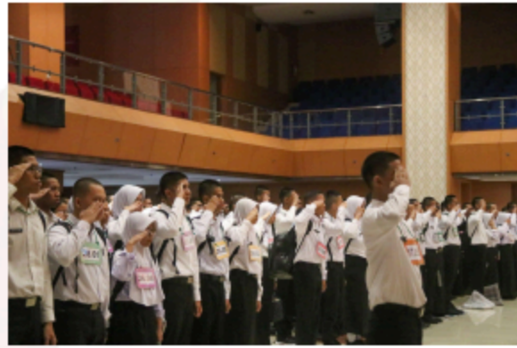
Gambar 12. Apel Sore