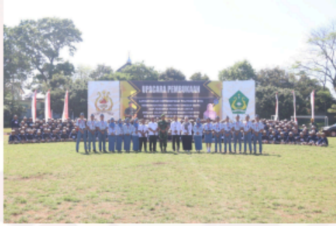
Gambar 25. Apel Pembukaan PKBN