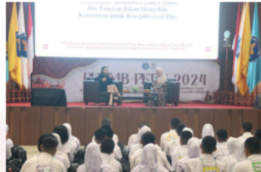
Gambar 20. Kuliah Umum Financial Plan