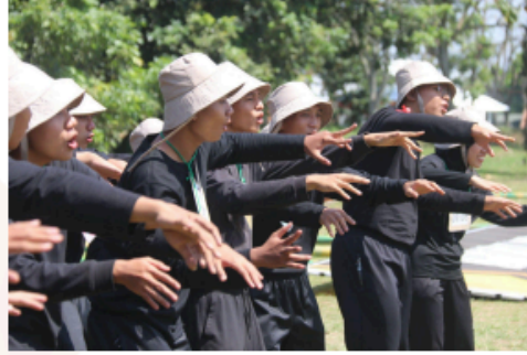
Gambar 26. Peraga Yel-Yel