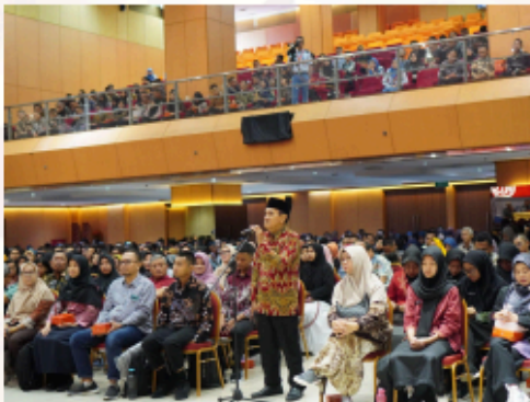
Gambar 3. Sesi Tanya Jawab Wali Mahasiswa kepada Pimpinan Politeknik Statistika STIS