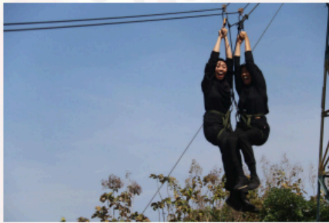
Gambar 27. Mountaineering