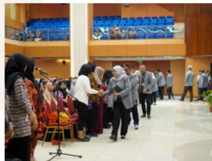
Gambar 2. Simbolik Ucapan Selamat Datang kepada Wali Mahasiswa Baru