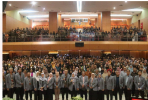
Gambar 4. Penutupan dan Dokumentasi