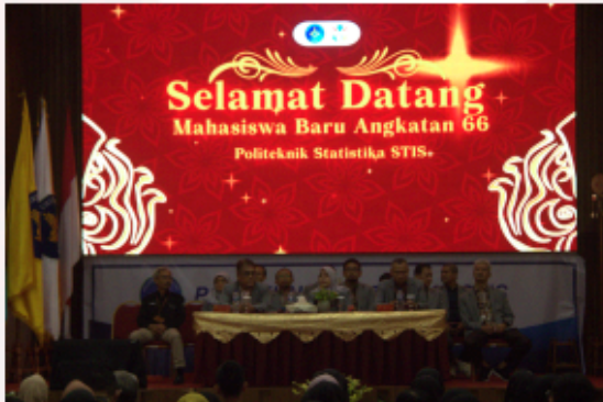
Gambar 1. Pimpinan Politeknik Statistika STIS Bersama Jajaran