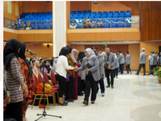
Gambar 2. Simbolik Ucapan Selamat Datang kepada Wali Mahasiswa Baru