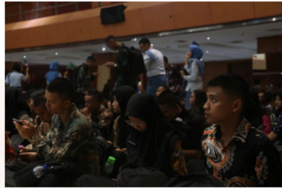
Gambar 8. Pre-Test