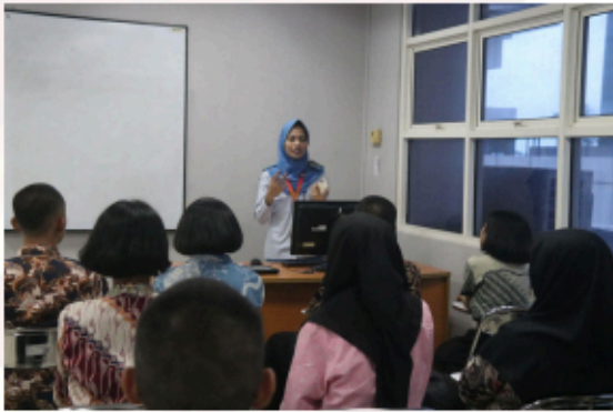
Gambar 7. Kegiatan Bersama Pendamping Kelompok