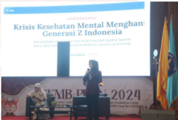
Gambar 13. Kuliah Umum tentang Kesehatan Mental