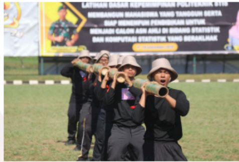
Gambar 28. Latihan Pertunjukan