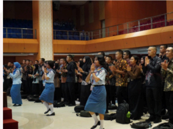
Gambar 6. Peraga Gerakan Lagu Angkatan 66